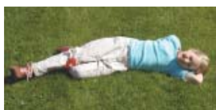
Den skadade flickan som ropar på hjälp