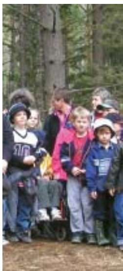
Några av drygt 100 barn

Välkomna att använda Barnens kyrkskog!!!!