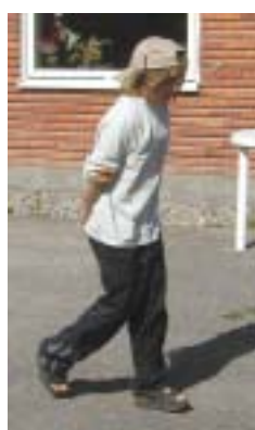
Den snälla buspojken som hjälper flickan