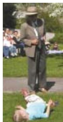
Den vuxna mannen som inte hjälper den skadade flickan