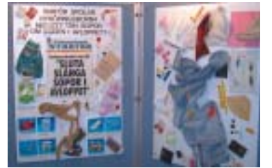
Detta har hittats i reningsverket!

Under vecka 46 och 47 hade vi glädjen att förfoga över utställningen "Jag älskar Östersjön", om miljö och vatten. Den stod uppställd i Stigtomta kyrka och i Vrena församlingshem och besöktes av kyrkans barn- och ungdomsgrupper, skolor och gudstjänstbesökare. Vattenutställningen handlade i grunden om Östersjön, men vi anknöt till de sjöar som finns runt vår församling. Att anordna denna utställning är ett led i det miljöarbete vi som församling arbetar med.