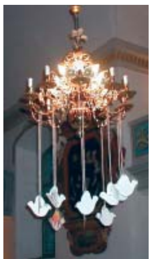
Fredsduvor svävar i kyrkan